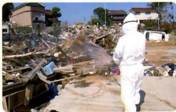
東日本大震災津波被災地での防疫活動