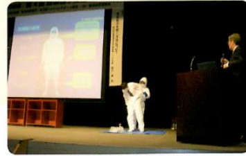
感染症対策講習会を開催