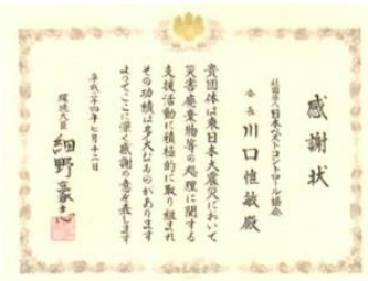
東日本大震災津波被災地での防疫活動に対する厚生労働省、環境省からの感謝状