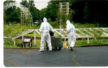
デング熱国内感染発生による代々木公園での蚊成虫駆除