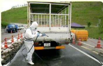
家畜伝染病まん延防止のため、消毒ポイントでの車両消毒